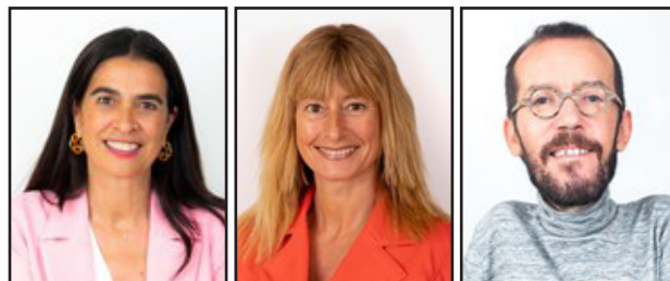
CONGRESO DE LOS DIPUTADOS

Tras las elecciones generales celebradas el 28 de abril tres físicos han obtenido escaño en el Congreso de los Diputados de la XIII Legislatura que se constituyó el pasado 21 de mayo.