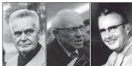
Jan Tinbergen (1903-1994), Andréi Sájarov (1921-1989) y Luis Álvarez (1911-1988).

No hablemos ya de los claros ejemplos de Galileo, Newton, Einstein... sino, por ejemplo, de cómo los físicos han estado presentes en todas las categorías del Premio Nobel: quizá no os sorprenderá saber que hay muchos que han sido Nobel de Química, pero... ¿y de Medicina o Fisiología? Pues mirad: Rosalyn Yalow lo ganó en 1977 por la técnica de radioinmunoensayo, Peter Mansfield en 2003 por la técnica de imagen basada en resonancia magnética nuclear e incluso eran físicos Francis Crick y Maurice Wilkins, que junto a James Watson ganaron el famoso Nobel de 1962, el del descubrimiento de la doble hélice de ADN. Para colmo, la inspiración de ese descubrimiento estuvo en el famoso ¿Qué es la vida? de Schrödinger... En economía,