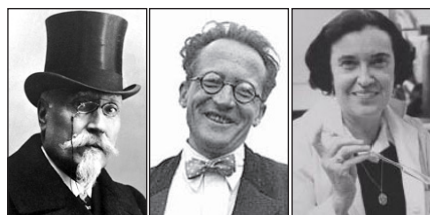
José Echegaray (1832-1916), Erwin Schrödinger (1887-1961) y Rosalyn Yalow (1921-2011).

Error: nosotros, que por ser tronco aportamos la savia a todo el árbol, somos los únicos que tenemos control total sobre él, hasta incluso para alimentar a sus frutos. Esa es nuestra fortaleza, como también ser los únicos que saben cómo está conectada