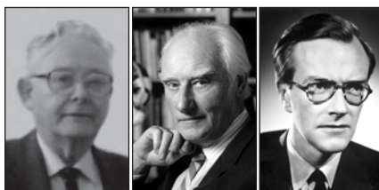
Peter Mansfield (1933-), Francis Crick (1916-2004) y Maurice Wilkins (1916-2004).

una rama con la de al lado. Rompamos un poco la moderación, abramos el grifo de nuestra autoestima (esa que veo que falta a algunos titulados jóvenes) y seamos conscientes de que, si la especie humana se define por su inteligencia capaz de controlar su entorno, la física es el principal producto de ella, marcando una de las cúspides de la actividad intelectual. Permitted que entre en vosotros una pizca de esa arrogancia que os haga sentir en el vértice de la pirámide de las ideas. Volved la mirada sobre los múltiples ejemplos de miembros insignes que jalonan la historia de la física: un elenco irreplicable en cualquier disciplina y cuya memoria nos hace ser símbolos depositarios de ese talento.